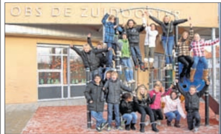
Groep 8 leerlingen van De Zuidooster hebben veel zin in de technieklessen. "Zullen we een houten boot bouwen en dan met gesoldeerde hekjes?!", stelt de leerling voor.