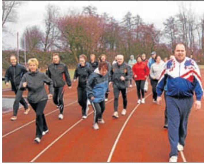
Veel enthousiaste deelnemers aan de Westeinderloop bij AV Aalsmeer