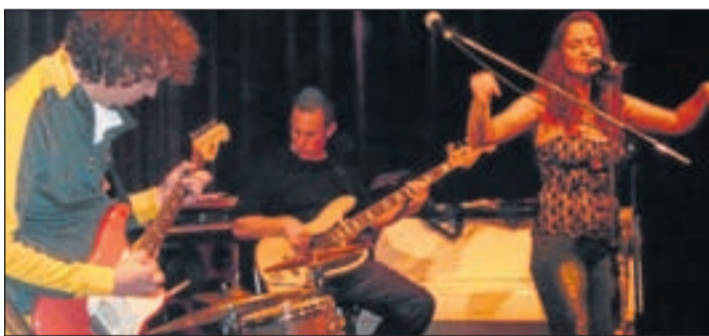
Afgelopen zaterdag werden de bezoekers van Bacchus getraakteerd op een optreden van de viermansformatie Jacky's Farm. Een gevarieerd repertoire werd gebracht. Het publiek beloonde het viertal regelmatig met luid applaus.

keur met het publiek te delen. Voor een goed onderhouden 'Technics' draaitafel (1978) voorzien van een nieuwe naald wordt gezorgd. Bezoekeers worden echter wel verzocht om geen hele kratten vol elpees of singles, maar een gouden greep uit de collectie mee te nemen. Voor meer informatie en de mogelijkheden kan een email gestuurd worden aan rem@cafebacchus.nl of naar job@cafebacchus.nl . Cultureel Café Bacchus is te vinden in de Gerberastraat 4. Meer informatie ook op www.cultureelcafebacchus.nl